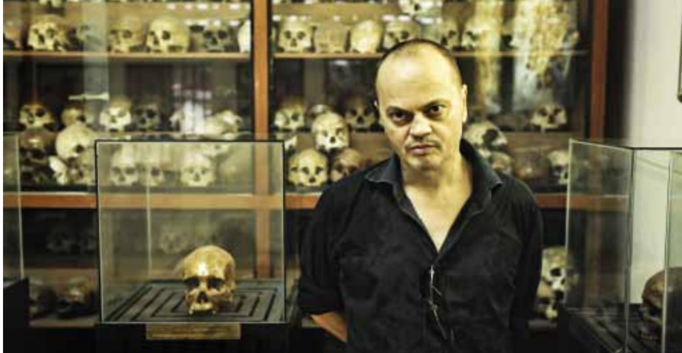
In de zaal van het voormalige martelcomplex staan honderden schedels van vermoorde Cambodjanen opgestapeld

► zwijsend trauma binnen mijn familie. En nu komt daar nog de Nederlandse context van die uitzettingscentra bij.