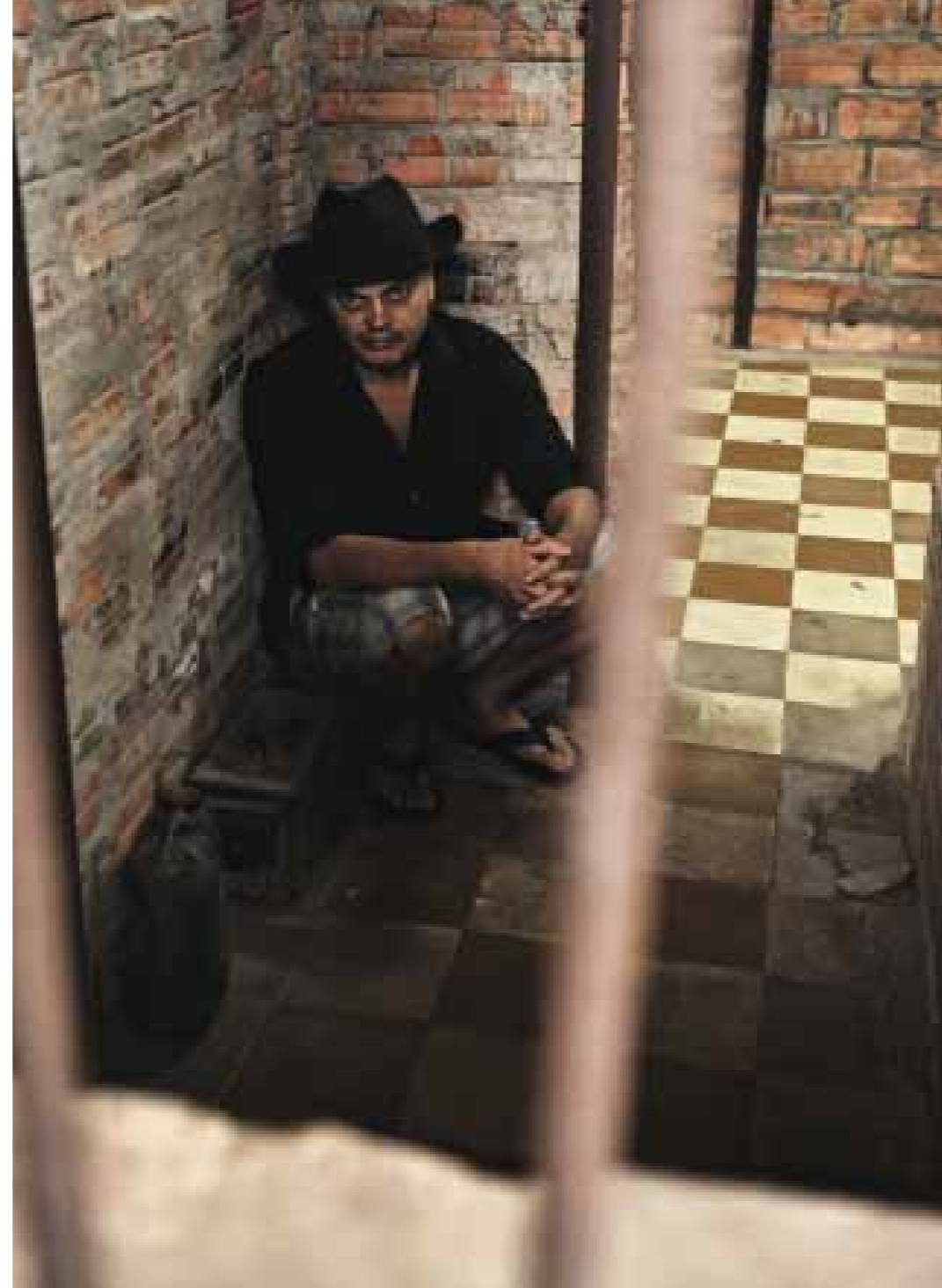
Klashorst exposeert in de voormalige martelwerkplaats

ken door de ringtone van zijn mobieltje. “Wacht even, telefoontje. Ja? No baby, I am working now. No, working. I can not meet, no. I'm with a journalist working and then painting. Listen, I am no tourist, okay? ”